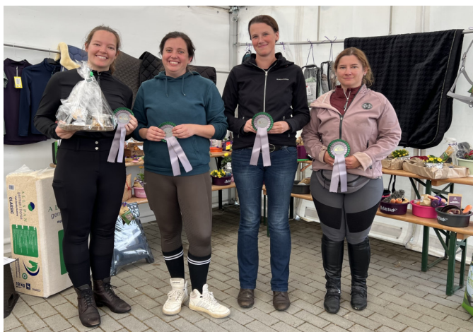
2. Platz „Die dunkle Macht“