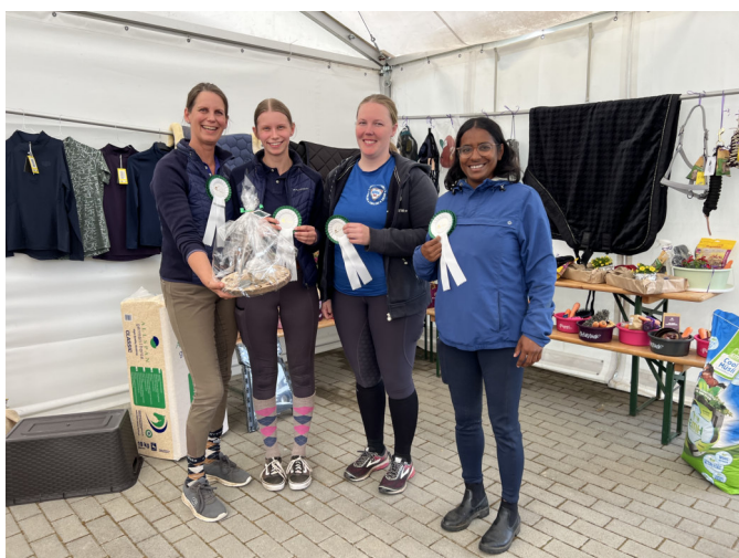
3. Platz „Die Moisburger“